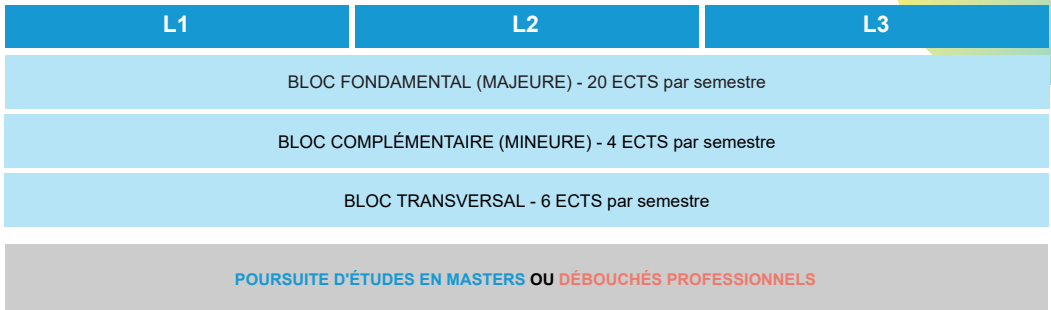
Schéma de formation